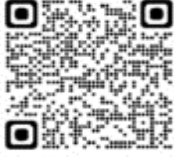
Anas bahamensis rubrirostris - Pato gargantilla