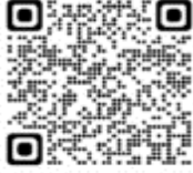
Anas cyanoptera cyanoptera - Pato colorado