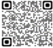
Chloephaga picta picta - Cauquén común