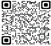
Anas georgica spinicauda - Pato maicero